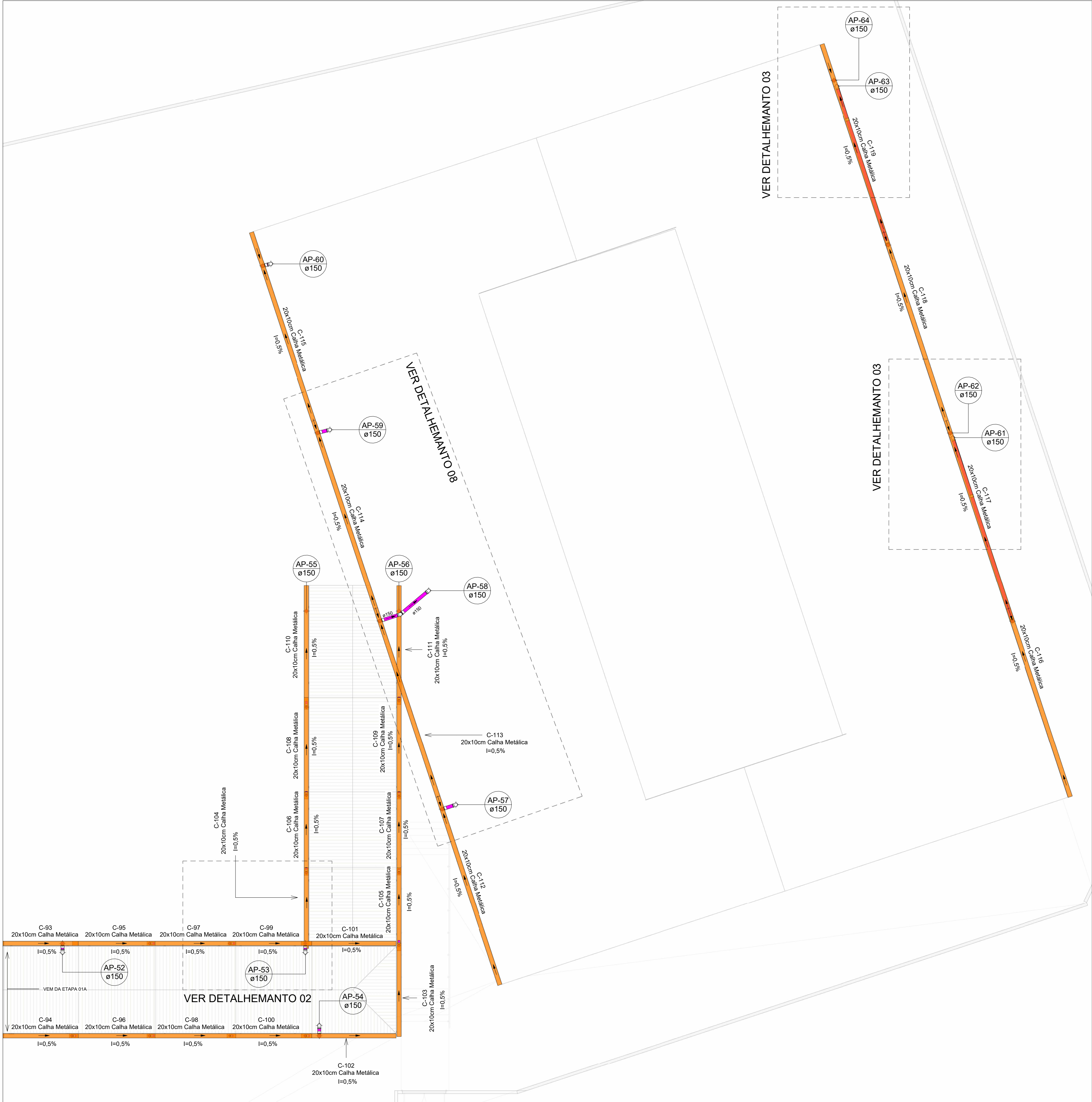
PLANTA BAIXA DRENAGEM PLUVIAL - COBERTURA ETAPA 01 B